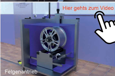
Hier gehts zum Video