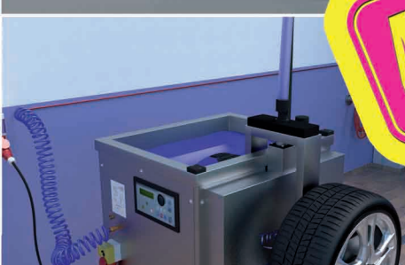
Abbildung zeigt Waschmaschine mit zusätzlichen Optionen