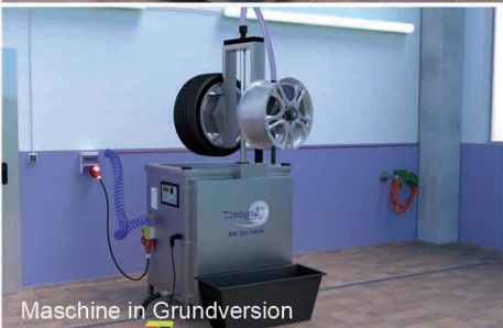
Maschine in Grundversion