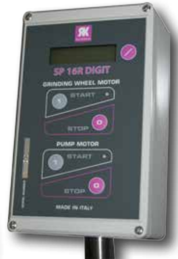
Nonio digitale Digital vernier