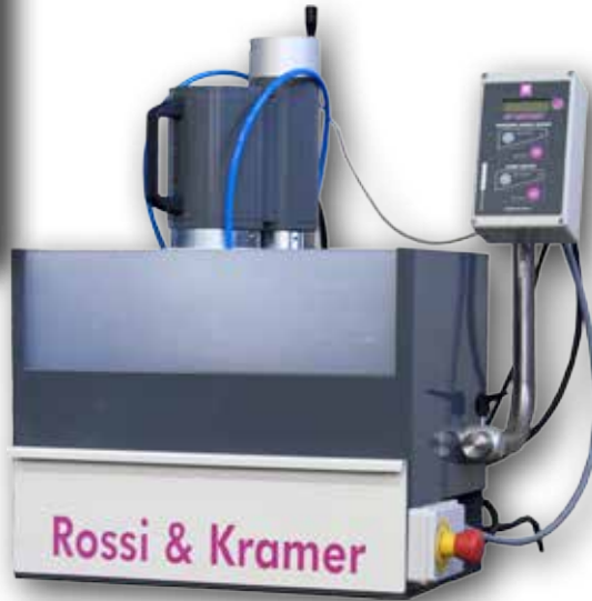
SP 16 S con carter paraspruzzi SP 16 S with splash guard