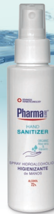
HAND SANITIZER SPRAY 100 ml