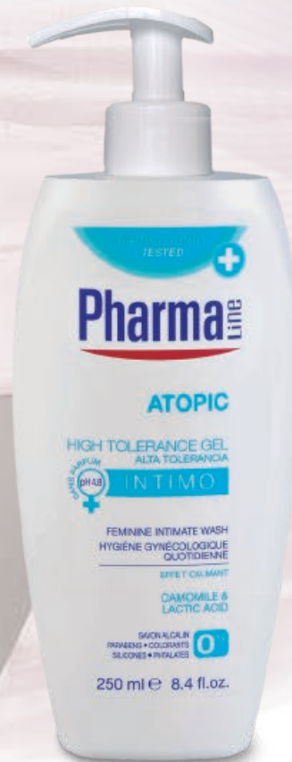
WASH ATOPIC 250 ml Camomile + Lactic Acid