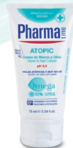
HAND & NAIL CREAM 75 ml Omega 3 & 6 + Urea + Aloe vera