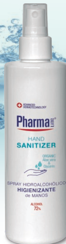
HAND SANITIZER SPRAY 200 ml