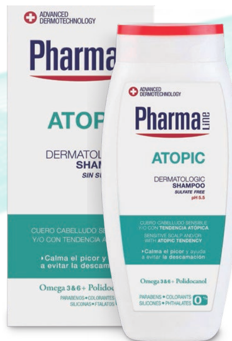
DERMATOLOGIC SHAMPOO 250 ml Omega 3 & 6 + Polidocanol