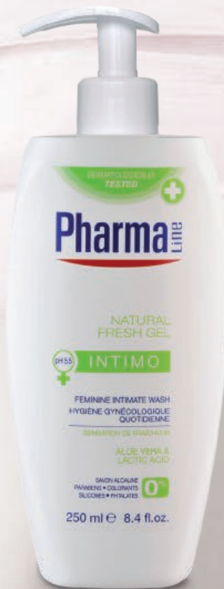
WASH NATURAL FRESH 250 ml Aloe vera + Lactic Acid

Les parties intimes féminines ont besoin d'un soin quotidien à l'aide de produits spécifiques très doux, présentant le même pH que celui de la zone vulvo-vaginale et composés d'ingrédients appropriés qui aident à maintenir une bonne hygiène intime.