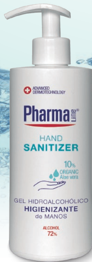
HAND SANITIZER GEL 450 ml