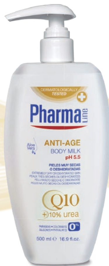
BODY MILK 500 ml Q10 + Urea + Aloe vera