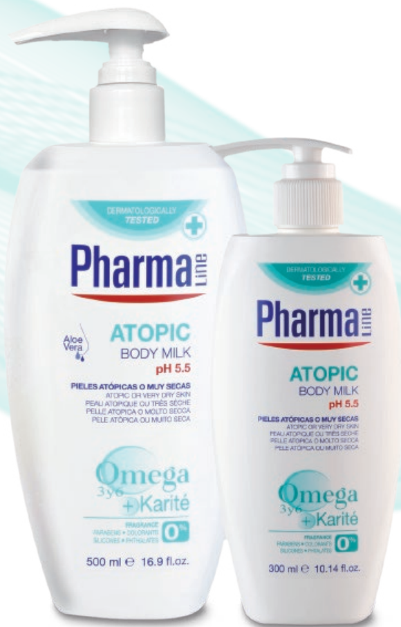
BODY MILK 500 ml/300 ml Omega 3 & 6 + Shea Butter + Aloe vera