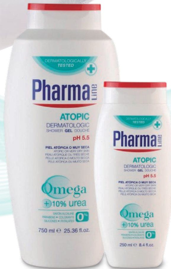
DERMATOLOGIC GEL 750 ml/250 ml

Les produits utilisés ne doivent pas contenir d'ingrédients allergènes ni de savons alcalins et il est important que leur formule soit élaborée dans le but d'apporter le maximum d'hydratation, avec des ingrédients émoullients et régénérateurs de la membrane lipidique.