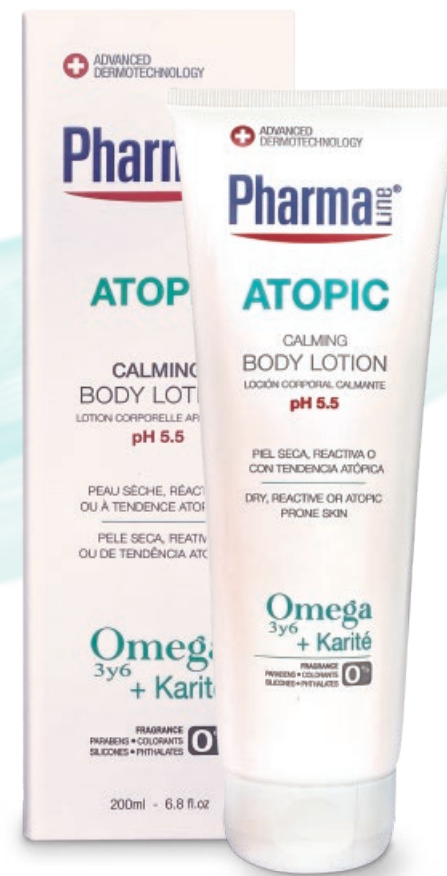
CALMING BODY LOTION 200 ml

Omega 3 & 6 + Karité + Aloe vera POLIDOCANOL