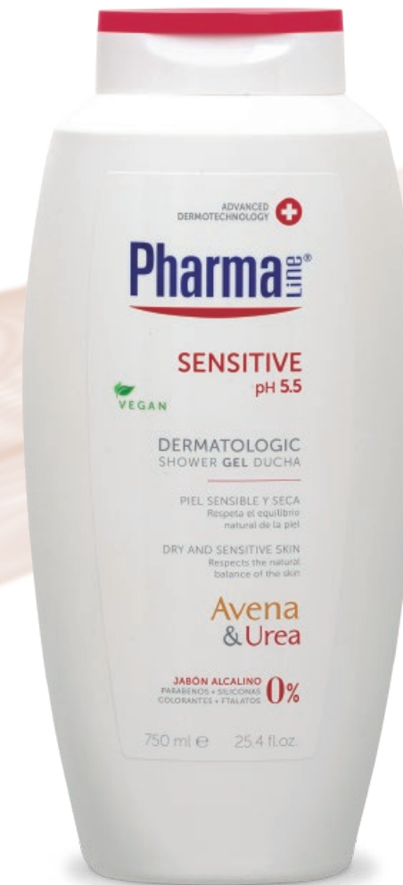
DERMATOLOGIC GEL 750 ml Avena Sativa + Urea