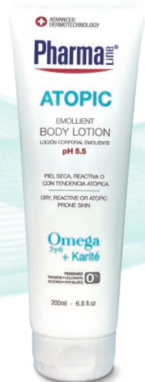
EMOLLIENT BODY LOTION 200 ml Omega 3 & 6 + Karité + Aloe vera