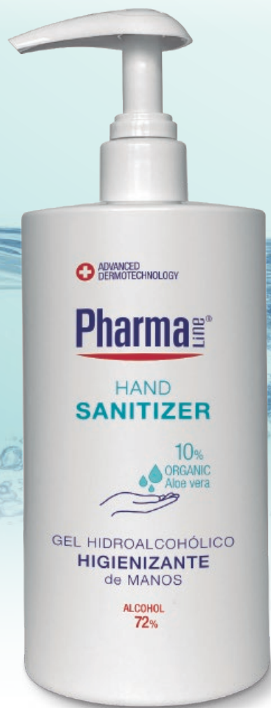
HAND SANITIZER GEL 750 ml

LIMPIEZA PROFUNDA Y PROTECCIÓN SIN AGUA NI JABÓN BASE HIDROALCOHÓLICA DEEP CLEANING AND PROTECTION WITHOUT SOAP OR WATER HYDROALCOHOLIC BASE NETTOYAGE EN PROFONDEUR ET PROTECTION SANS EAU NI SAVON BASE HYDROALCOOLIQUE