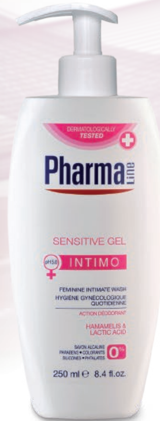
WASH SENSITIVE 250 ml Hamamelis + Lactic Acid