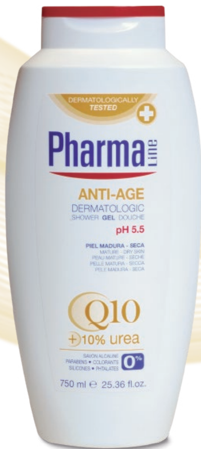
DERMATOLOGIC GEL 750 ml Q10 + Urea

Pour cela, il est nécessaire d’utiliser des produits apportant une bonne hydratation à la peau et contenant des ingrédients favorisant sa rénovation, la rendant plus douce et lumineuse.