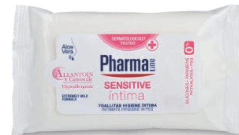
HYGIENE WIPES 12 un. Allantoin + Camomile + Aloe vera