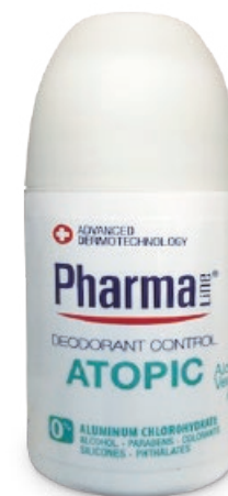
DEODORANT CONTROL 50 ml Mineral Alum + Aloe vera