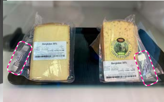
Etiketten auf den Waren