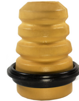
JUMPER III-BOXER II-DUCATO III