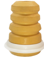
JUMPER III-DUCATO III-BOXER III

OE NO: 5033.E6 - 5033.A7 5033.A9-50705220