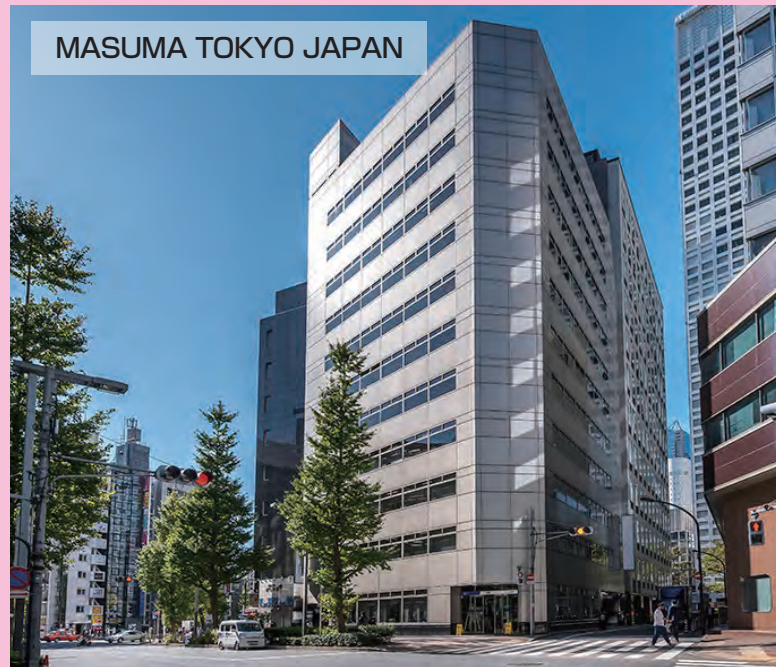
MASUMA TOKYO JAPAN

マスマは1998年に設立されました。マスマオートスベアパーツ株式会社は、東京に本社を置いています。これは、独立した知的財産権とR&Dと製造を統合した国際的な自動車部品企業です。マスマ本社は、新製品の設計・研究開発やグローバル産業における最先端技術の集積を担うとともに、関連する研究開発成果や応用技術を下位工場に発信しています。