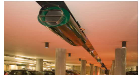
TIEFGARAGE RATHAUS / ULM Rauchkontrolle auf zwei Ebenen mit drei Lüftungszentralen

NOVENCO Building & Industry Deutschland Neuffenstraße 56 89168 Niederstotzingen Tel. + 49 7325 504 97- 48 Mail: info-de@novenco-building.com www.novenco-building.com/de