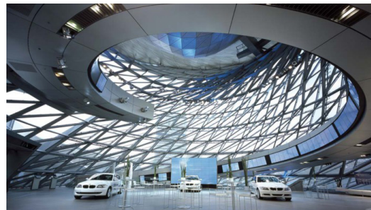
BMW WELT / MÜNCHEN Belüftung und Entrauchung von vier Abschnitten über eine Lüftungszentrale