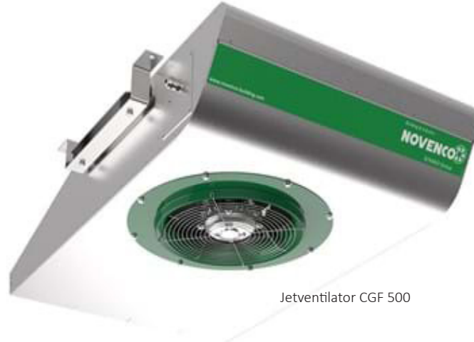
Jetventilator CGF 500