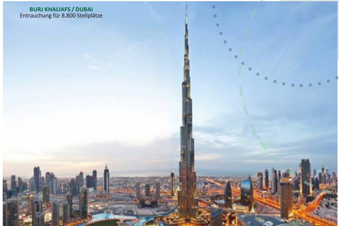
BURJ KHALIAFS / DUBAI Entrauchung für 8.800 Stellplätze