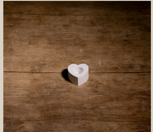
2007 617 VE 6 Silikonform Kerzenhalter Herz ca. 4,5 x 2,5 cm Füllmenge 55g