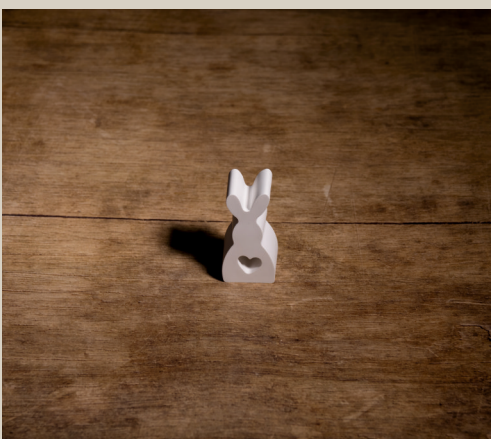
2007 627 VE 6 Silikonform Hase ca. 7,5 x 3,5 x 2,5 cm Füllmenge 70g