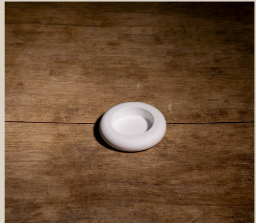
2007 623 VE 6 Silikonform Teelichthalter Rund ca. 8,5 x 2 cm Füllmenge 120g