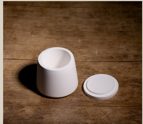
2007 631 Silikonform Dose m. Deckel ca. 8,5 x 7,5 cm Füllmenge 500g