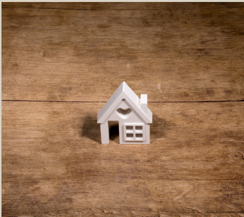
2007 648 VE 6 Silikonform Haus ca. 9 x 7 x 1,5 cm Füllmenge 100g