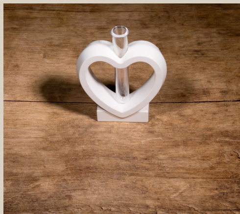
2007 645 VE 6 Silikonform Vase Herz ca. 13,5 x 12 x 3 cm Füllmenge 305g