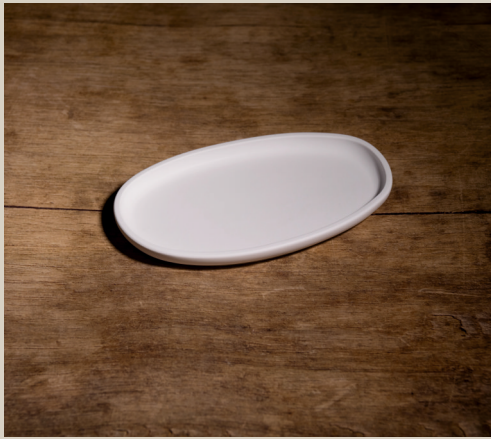
2007 634 Silikonform Schale ca. 19 x 11,5 x 1,5 cm Füllmenge 210g