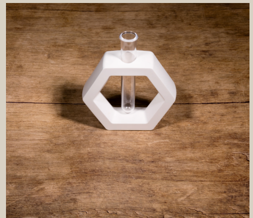
2007 646 VE 6 Silikonform Vase Sechseck ca. 10,5 x 12 x 3,5 cm Füllmenge 205g