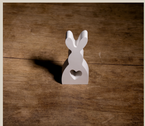
2007 628 VE 6 Silikonform Hase ca. 12,5 x 5,5 x 2,5 cm Füllmenge 175g