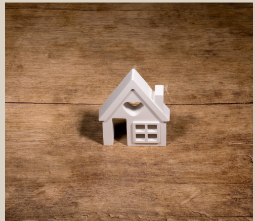
2007 649 VE 6 Silikonform Haus ca. 11 x 9 x 2 cm Füllmenge 175g