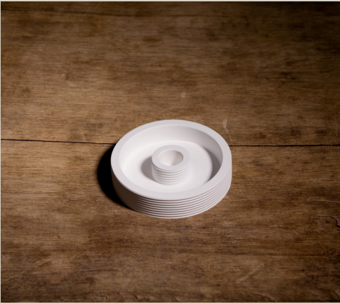
2007 636 VE 4 Silikonform Kerzenhalter ca. 11 x 2,5 cm Füllmenge 200g