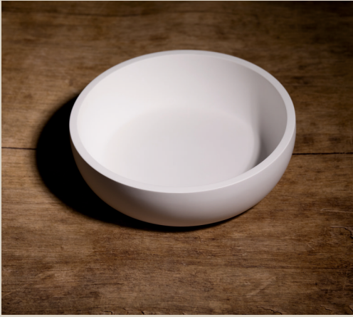
2007 635 VE 4 Silikonform Schale ca. 20,5 x 6 cm Füllmenge 860g