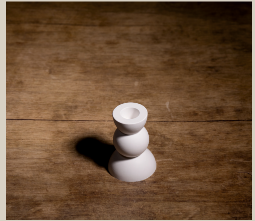
2007 615 VE 6 Silikonform Kerzenhalter V ca. 8,5 x 5,5 cm Füllmenge 190g