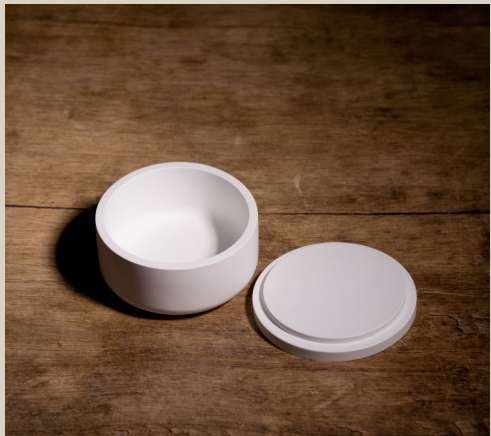
2007 630 Silikonform Dose m. Deckel ca. 10,5 x 6 cm Füllmenge 420g