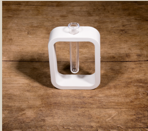
2007 643 VE 6 Silikonform Vase Rechteck ca. 14 x 10,5 x 3,5 cm Füllmenge 290g