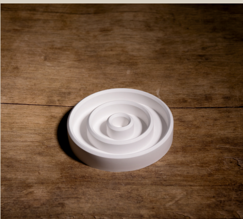
2007 637 VE 4 Silikonform Kerzenhalter ca. 14 x 2,5 x 2,5 cm Füllmenge 335g