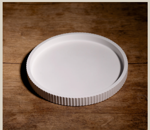
2007 639 VE 4 Silikonform Teller ca. 21 x 2,5 cm Füllmenge 525g