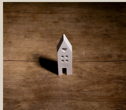
2007 625 VE 6 Silikonform Haus ca. 11,5 x 3,5 x 2,5 cm Füllmenge 130g