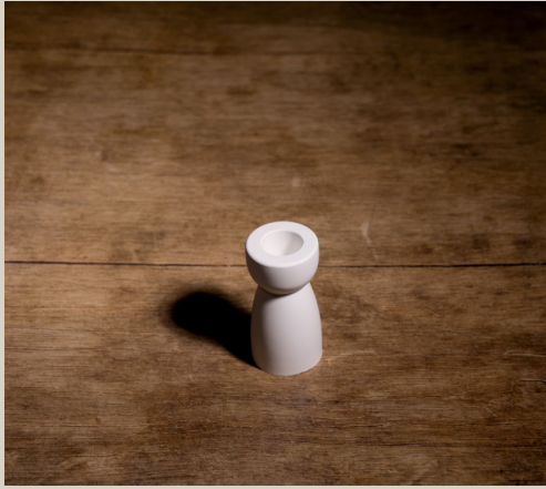
2007 614 VE 6 Silikonform Kerzenhalter IV ca. 8 x 4 cm Füllmenge 140g