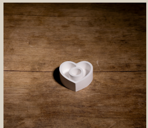
2007 619 VE 6 Silikonform Kerzenhalter Herz ca. 8 x 2,5 cm Füllmenge 90g