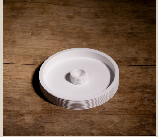
2007 638 VE 4 Silikonform Kerzenhalter ca. 16,5 x 2,5 cm Füllmenge 355g