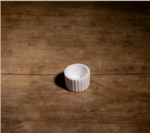
2007 622 VE 6 Silikonform Teelichthalter Rund ca. 3,5 x 4,5 cm Füllmenge 80g