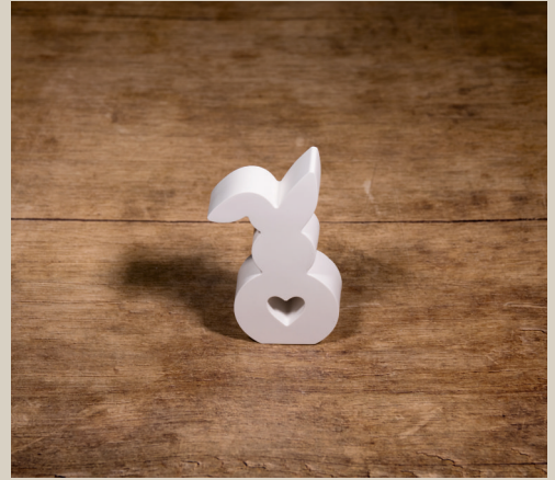
2007 642 VE 6 Silikonform Hase ca. 12 x 7 x 2,5 cm Füllmenge 200g