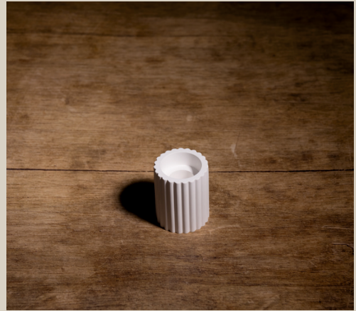
2007 621 VE6 Silikonform Kerzenhalter Rund ca. 6 x 4,5 cm Füllmenge 130g