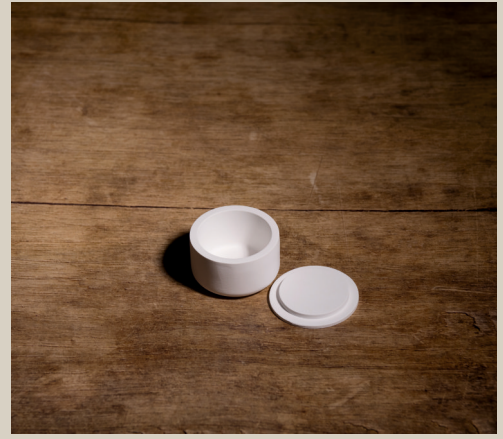
2007 629 Silikonform Dose m. Deckel ca. 5,5 x 3 cm Füllmenge 80g