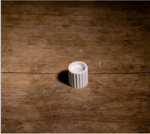
2007 620 VE 6 Silikonform Kerzenhalter Rund ca. 4 x 4 cm Füllmenge 65g