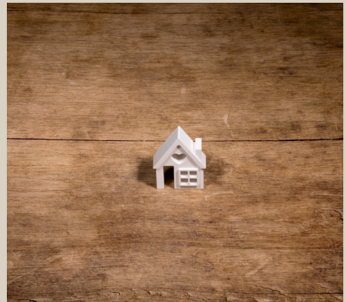
2007 647 VE 6 Silikonform Haus ca. 6,5 x 5 x 1,5 cm Füllmenge 50g