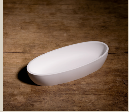
2007 640 VE 4 Silikonform Schale ca. 21,5 x 8,5 x 4 cm Füllmenge 390g