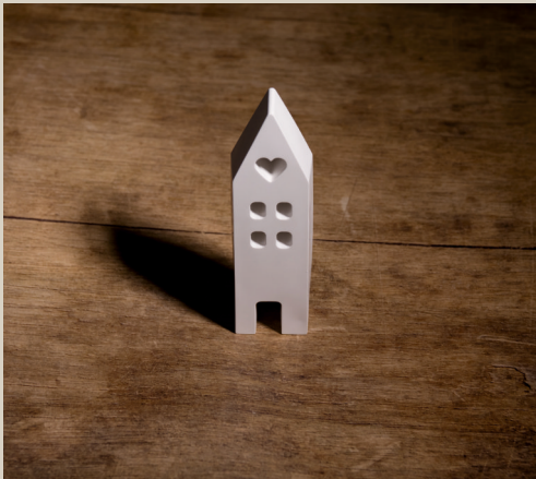
2007 626 VE 6 Silikonform Haus ca. 15 x 4 x 2,5 cm Füllmenge 190g