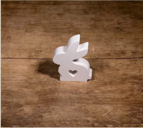
2007 641 VE 6 Silikonform Hase ca. 11,5 x 8 x 2,5 cm Füllmenge 230g