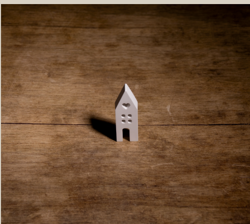
2007 624 VE 6 Silikonform Haus ca. 8,5 x 2,5 x 1,5 cm Füllmenge 40g