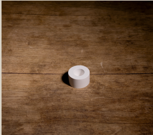
2007 616 VE 6 Silikonform Kerzenhalter Rund ca. 4,5 x 2,5 cm Füllmenge 60g