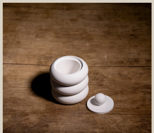
2007 633 Silikonform Dose m. Deckel ca. 10,5 x 8 cm Füllmenge 420g