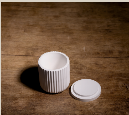
2007 632 Silikonform Dose m. Deckel ca. 8,5 x 7 cm Füllmenge 265g