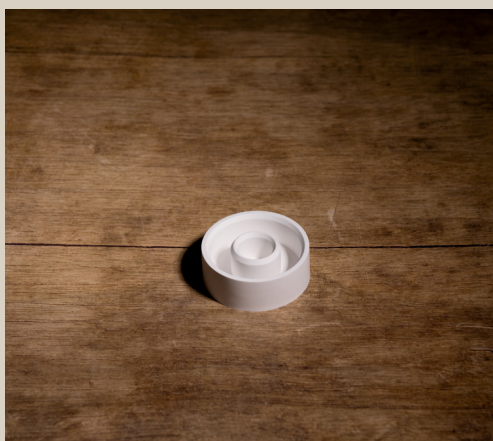
2007 618 VE 6 Silikonform Kerzenhalter Rund ca. 7 x 2,5 cm Füllmenge 80g