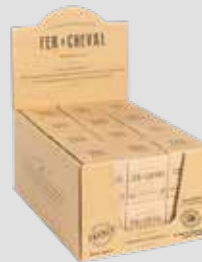
Cube Olive 100g Olive Cube 100g