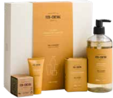
Coffret Signature Parfumé - Miel & Amande Signature Scented Gift Set - Honey & Almond 028202 - Coffret cadeau - PCB 4