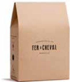
Pochette Cadeau Kraft + Sticker Kraft Gift Pouch + Sticker M9240 - Kraft - 14,8 x 8,2 x 22,2 cm - PCB 10