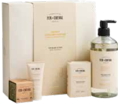
Coffret Signature Parfumé - Thé Blanc & Yuzu Signature Scented Gift Set - White Tea & Yuzu 028201 - Coffret cadeau - PCB 4