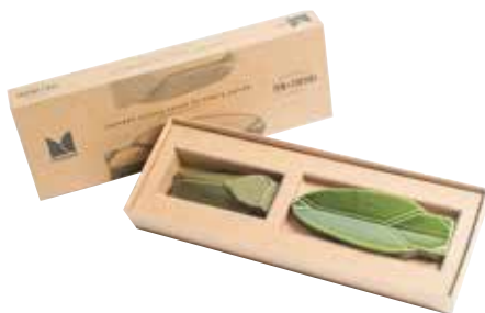
Coffret Monochromic Cigale Pur Olive Pur Olive Monochromic Cicada Gift Set 028002 - Coffret Cadeau - PCB 4