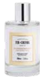
Eau Fraîche Parfumée – Thé blanc & Yuzu Fresh Scented Water - White Tea & Yuzu 025271 - Flacon 100ml - 3.30 fl.oz - PCB 6 025271T référence testeur disponible