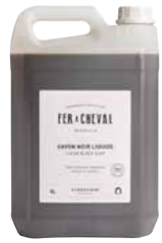
Savon Noir Liquide à l'Huile d'Olive Liquid Black Soap with Olive Oil 025030 - Flacon 5L - 169,07 fl.oz - PCB 4