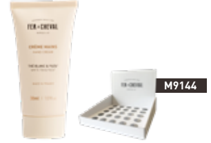
Crème Mains – Thé Blanc & Yuzu Hand Cream - White Tea & Yuzu 026295 - Tube 30ml - 1.01 fl.oz - PCB 15