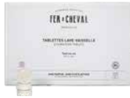
Tablettes Lave-Vaisselle - 40 tablettes x 18g Dishwashing Tablets - 40 tablets x 18g 024410 - 720g - 25.39 oz - PCB 11