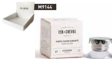
Porte-Savon Aimanté x 1 Soap Holder x 1 028105 - 3,5 x 3,5 x 3,5 cm - PCB 36