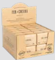
Savonnette Olive 100g Olive Toilet Soap 100g