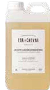
Lessive Liquide Concentrée Concentrated Laundry Liquid 025240 - Bidon 2L - 70,38 fl.oz - PCB 4