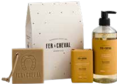
Pochette de Noël Miel & Amande Honey & Almond Christmas Pouch 028110 - Coffret cadeau - PCB 3

You can also opt for the DIY version with our kraft paper pouch and matching sticker to create your own personalized gift.