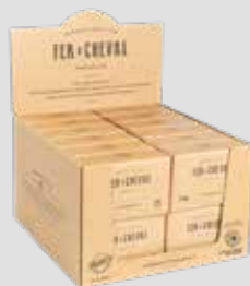
Savonnette Olive 250g Olive Toilet Soap 250g