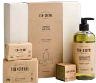
Coffret Pur Olive Pure Olive Gift Set 028220 - Coffret cadeau - PCB 4