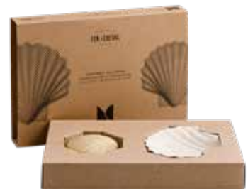
Coffret Monochromic Calypso Monochromic Calypso Gift Set 028014 - Coffret Cadeau - PCB 4