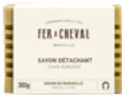
Savon Détachant au Savon de Marseille Stain Remover with Marseille Soap 021429 - Savon 300g - 10,58 oz - PCB 12