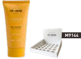
Crème Mains – Miel & Amande Hand Cream - Honey & Almond 026296 - Tube 30ml - 1.01 fl.oz - PCB 15