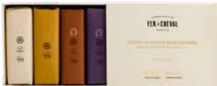
Coffret de Savons Doux Parfumés Gentle Perfumed Soaps Gift Set 028200 - Pack 4 x 125g - 4 x 4,41 oz - PCB 8