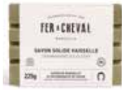
Savon Solide Vaisselle Dishwashing Solid Soap 022411 - Savon 225g - 7.93 oz - PCB 18