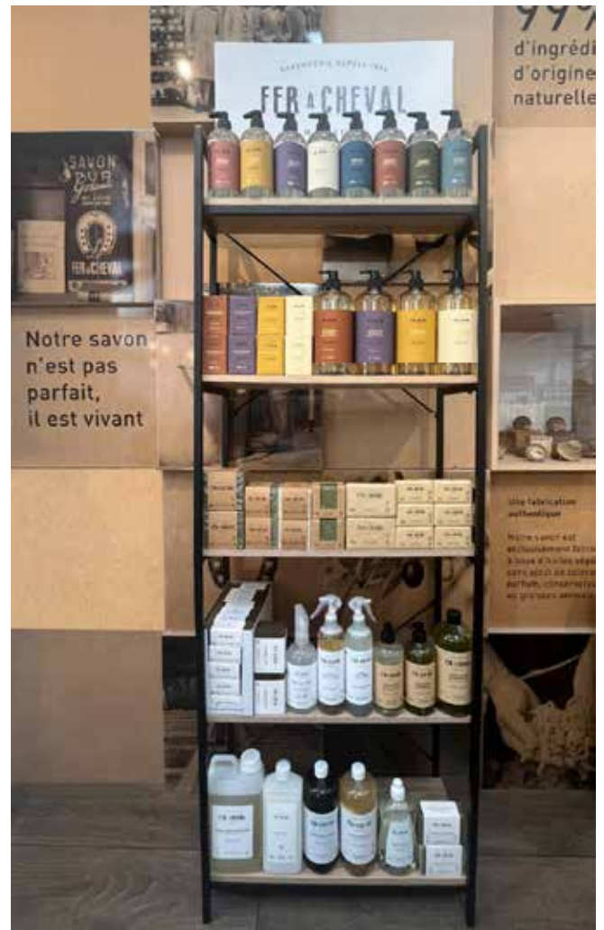
Présentoir Métal / Bois + Fronton Metal / Wood Display + Fronton M9146 + M9146F1 - 170 x 60 x 30 cm - PCB 1