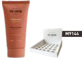
Crème Mains – Pétales de Rose Hand Cream - Rose Petals 026294 - Tube 30ml - 1.01 fl.oz - PCB 15