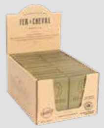
Tranche Olive 65g Olive Slice 65g