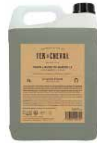
Savon Liquide de Marseille à l'Huile d'Olive Liquid Marseille Soap with Olive Oil 025235 - 1L - 35,19 fl.oz - PCB 6