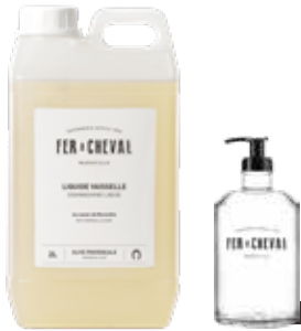
Liquide Vaisselle Dishwashing Liquid 025245 - Bidon 2L - 70,38 fl.oz - PCB 4