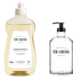
Liquide Vaisselle Dishwashing Liquid 026229 - Flacon 500ml - 17,59 fl.oz - PCB 12