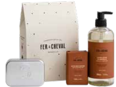
Pochette de Noël Fleur d'Oranger Orange Blossom Christmas Pouch 028111 - Coffret cadeau - PCB 3