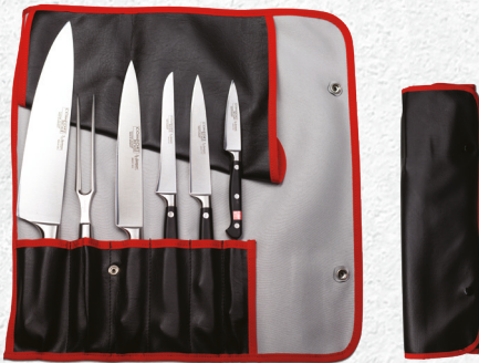
9650.911.00.0 Messertasche 6-teilig Cooks Knife Set 6 PCs

Enthalten/included 6860.911.20.0 6880.911.15.0 6910.911.09.0