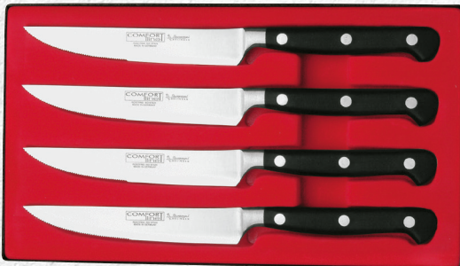
9610.911.00.3 Steakmessersatz 4-teilig Steak Knife Set 4 PCs

Enthalten/included Steakmesser/Steak Knife 6830.911.12.3