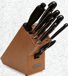
1461.911.00.0 Messerblock 9-teilig Knife Block with 9 PCs