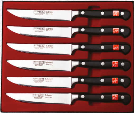
9600.911.00.3 Steakmessersatz 6-teilig Steak Knife Set 6 PCs

Enthalten/included Steakmesser/Steak Knife 6830.911.12.3