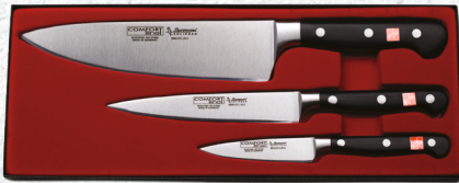
9350.911.00.0 Kochmessersatz 3-teilig Chef Collection Set 3 PCs

Enthalten/included 6830.911.12.3 8070.911.12.0