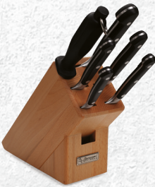
1460.911.00.0 Messerblock 6-teilig Knife Block with 6 PCs