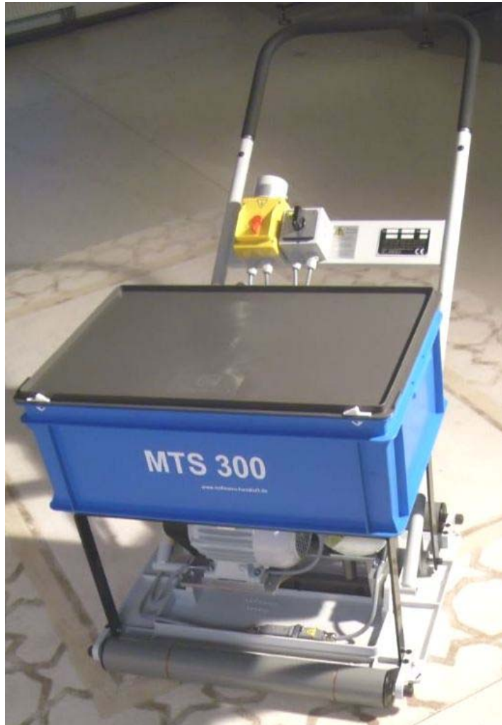
Bild zeigt MTS 300 mit angebauter Absaugung