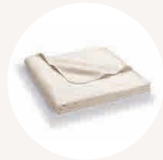
weich, waschbar, robust