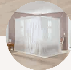
optimale Ergänzung zum Baldachin für besten Rundum-Schutz im Schlaf